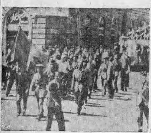
La gráfica que ofrecemos muestra uno de los numerosos choques producidos en Roma entre las multitudes monarquistas enfurecidas por el triunfo de la república y las autoridades encargadas de mantener el orden. Esta magnífica foto de nuestro servicio NEA, fué tomada en Roma el sábado a las diez horas de la mañana.